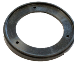
Ausgleichsgummi 7mm (2,1°) für 130er Lochkreis (B1) (PN: 007533300652)