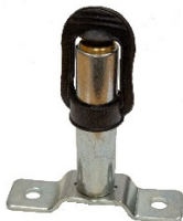
Aufsteckbuchse mit Montageplatte (PN: F16065)