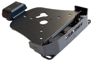
Universalhalter für Kennleuchten (Stück) (PN: 50148400850)