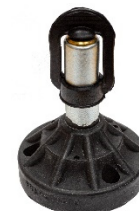
Aufsteckrohr mit flexibler Platte (PN: F17126)