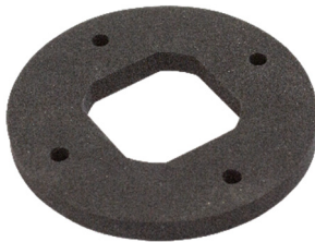
Dichtung für Flachmontage RHODON (PN: 008508381652)