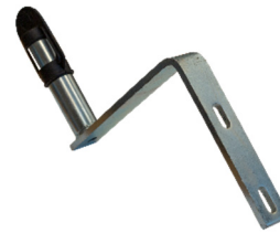
Aufsteckrohr abgewinkelt, 2polig (PN: 007528120652)