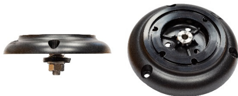
Flachsockel mit Befestigung (PN: F21703)